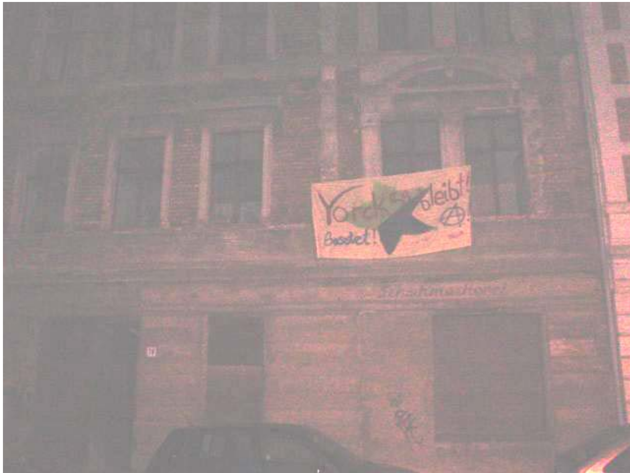
Solibesetzung im baufälligen Buckau