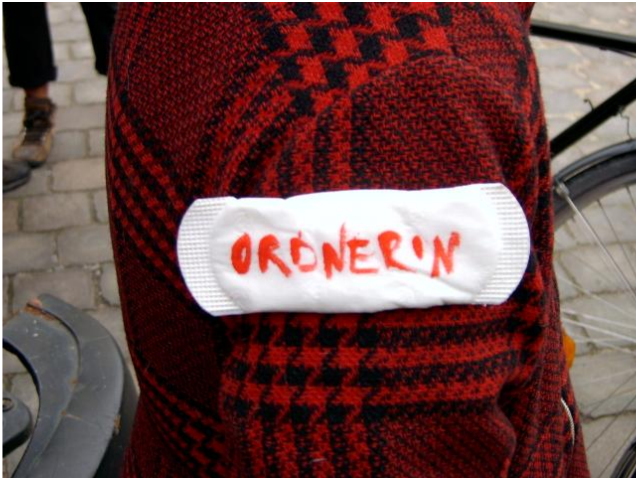
die Binden :-)