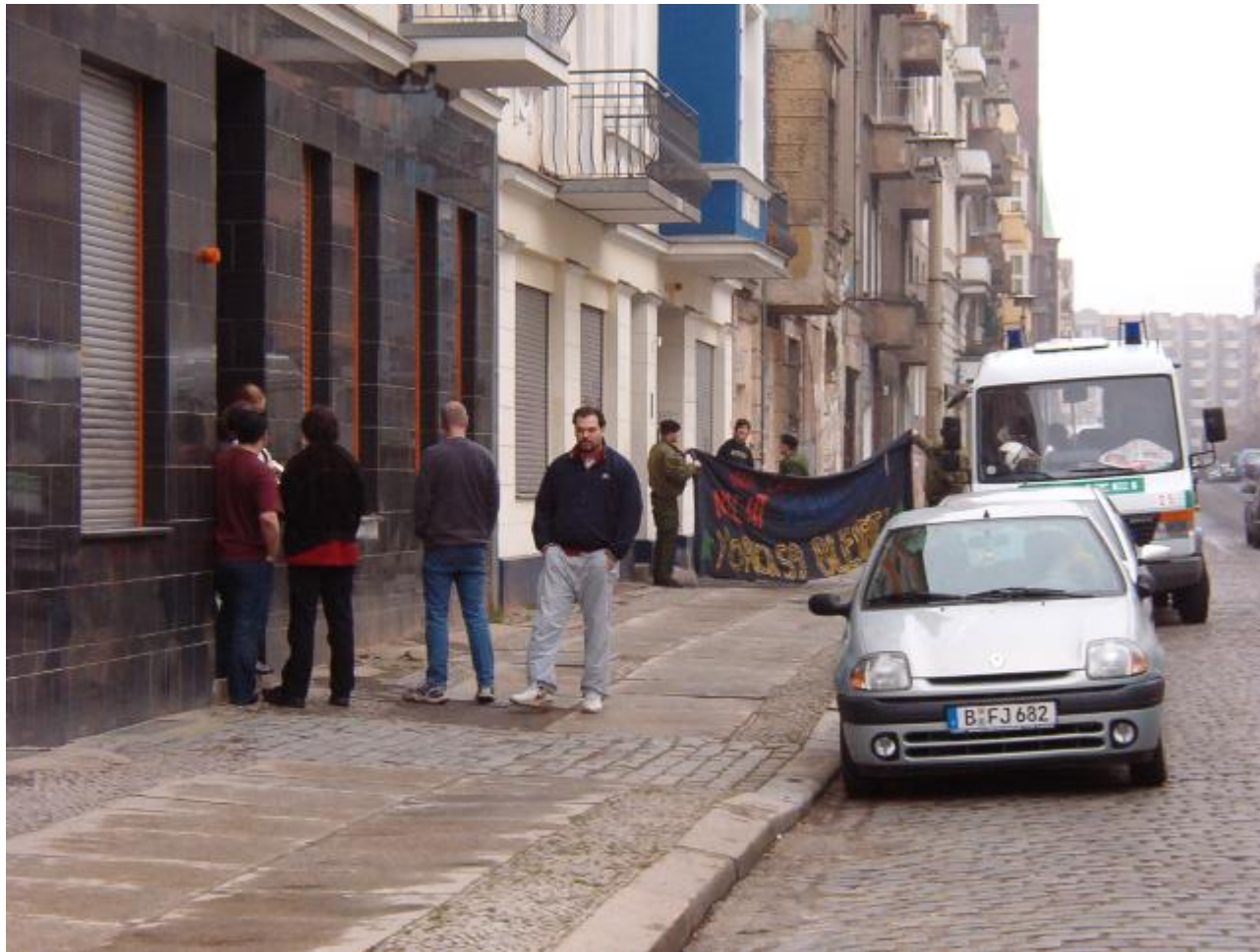
Repressionen am Anfang