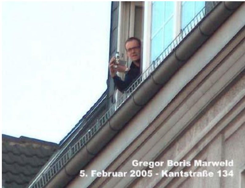
Der liebe Marweld