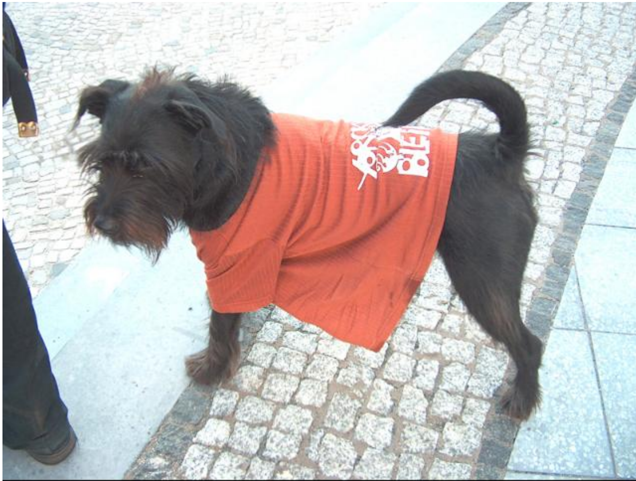
Yorck59 Soli Hund