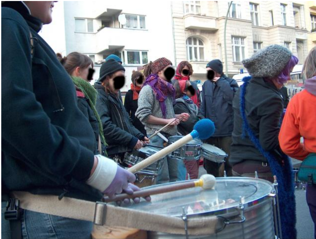
Die Samba Band