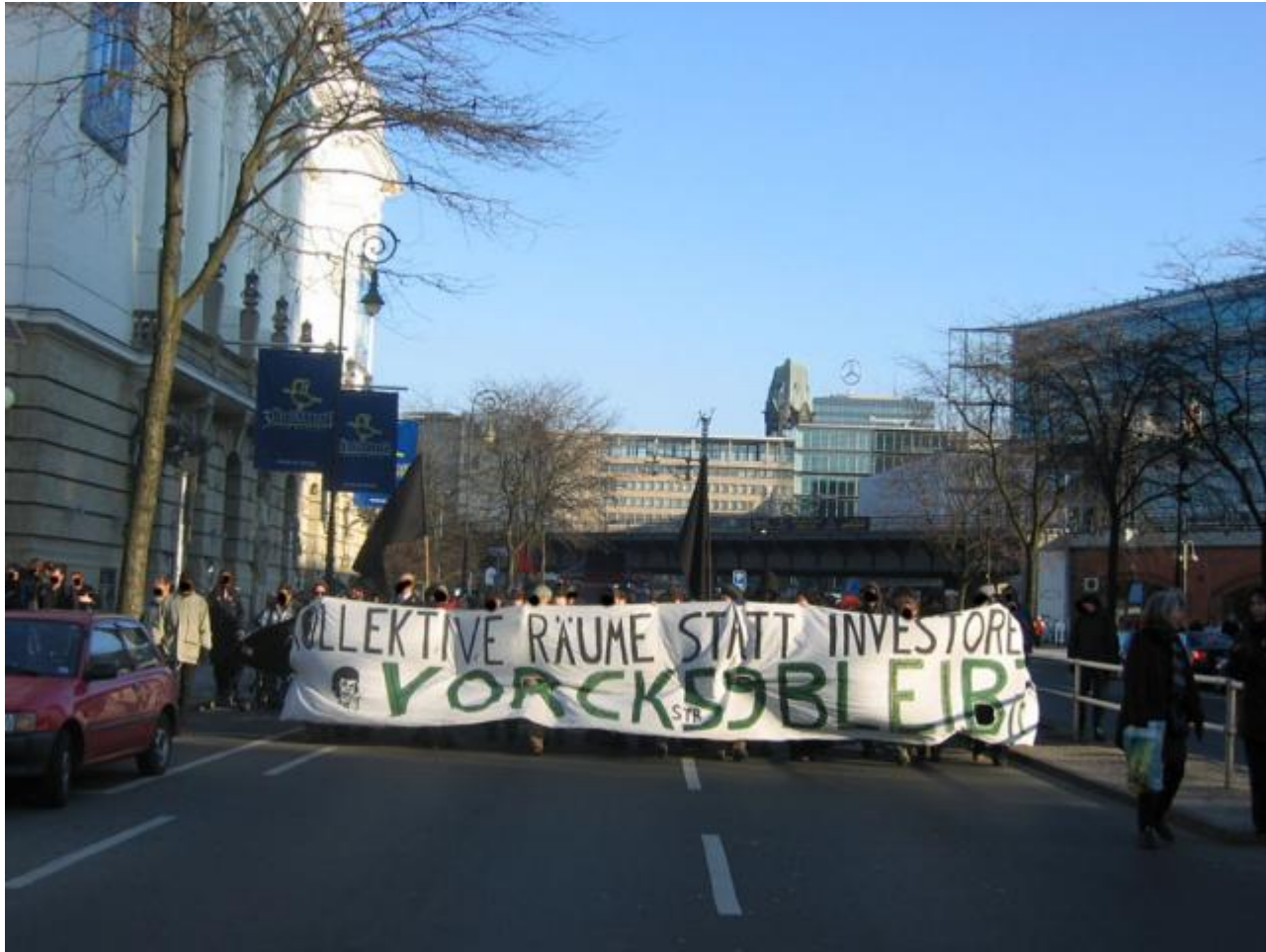
In der Kantstraße kurz nach dem Start