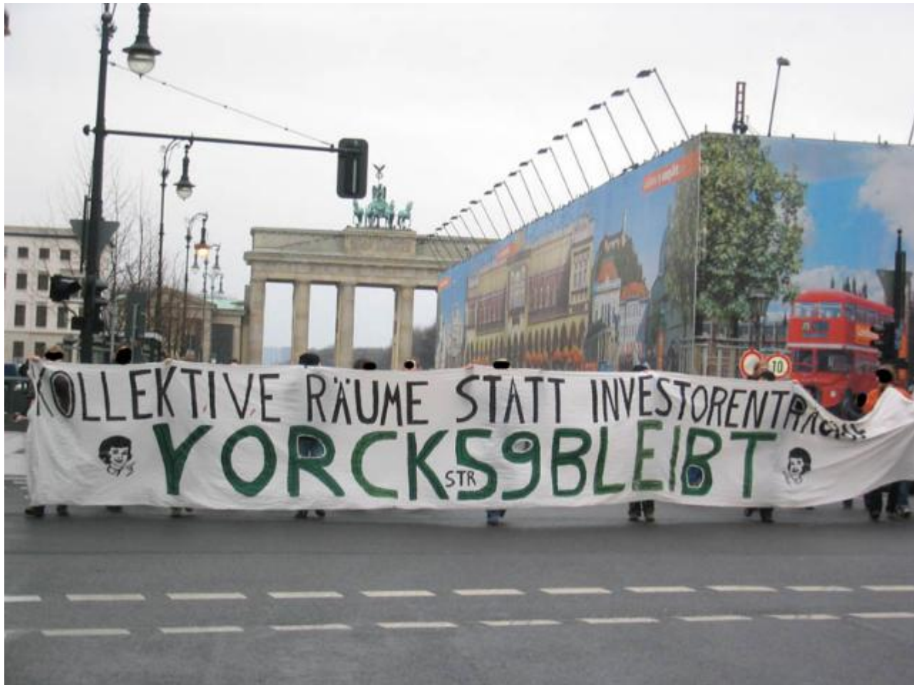
Spontandemo Unter den Linden