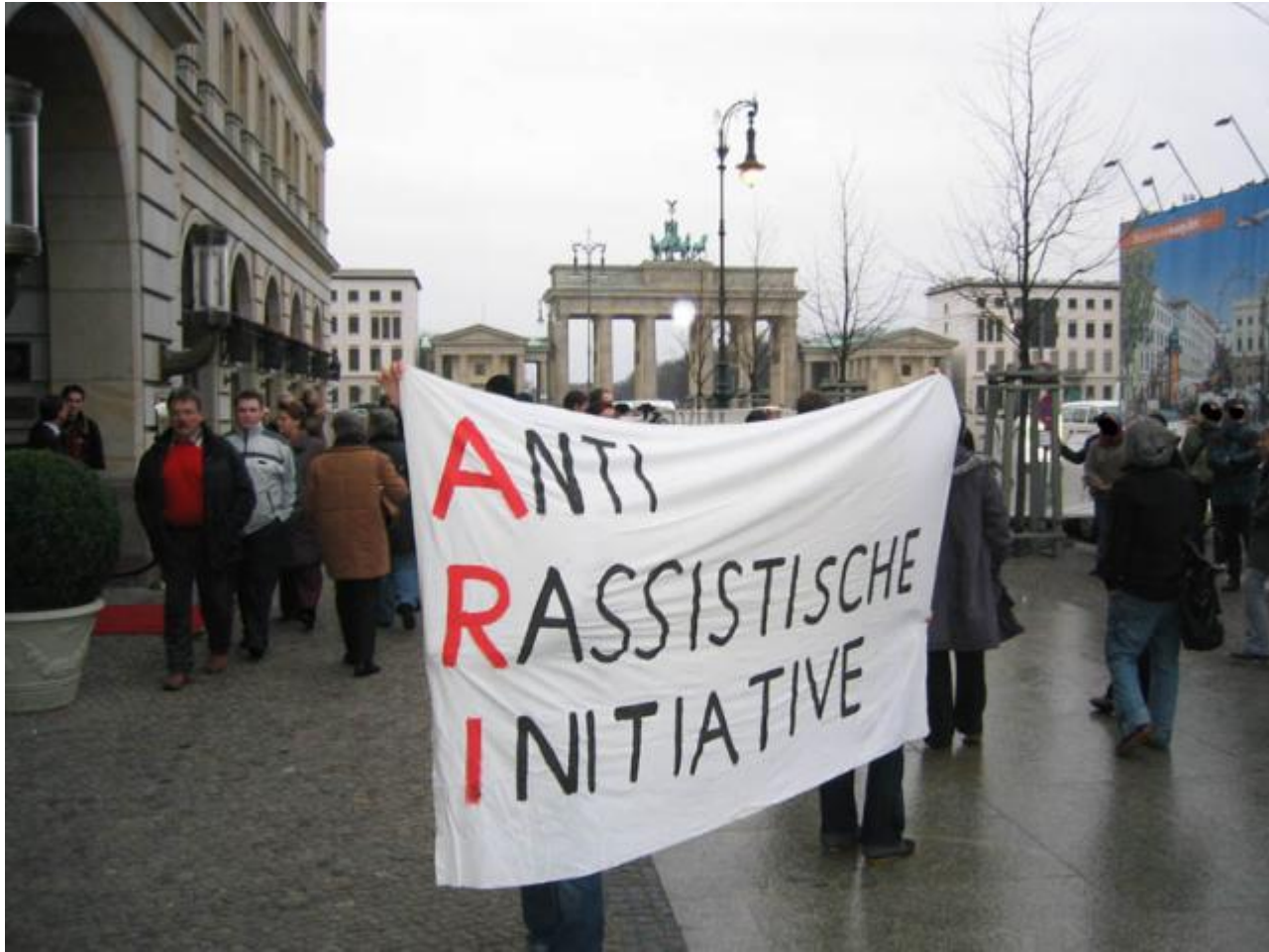
Auch von der anstehenden Räumung Betroffen