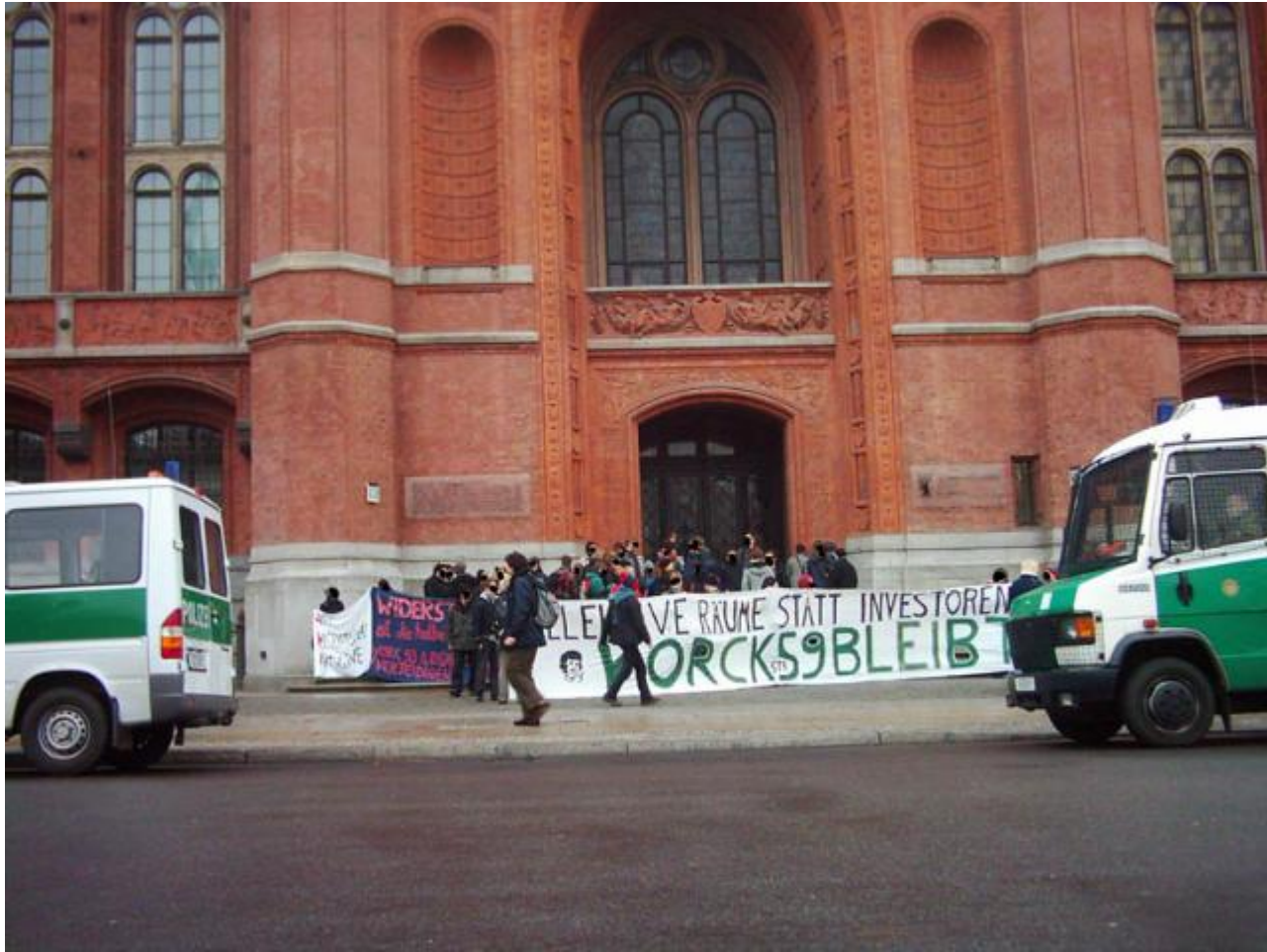
Vor dem Roten Rathaus...