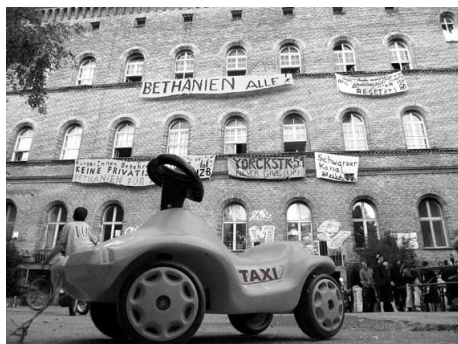
Vorm Bethanien-Südflügel mit dem Öko-Taxi.

Geprägt war das Jahr von sehr verschiedenen Dingen: Zum einen von der Aushandlung eines langfristigen Selbstverwaltungsvertrags, der eine 5- bis 15jährige Perspektive bietet, und den ersten Schritten der NewYorck hin zu einem Selbstverwaltungsprojekt mitsamt Bauen und einer Selbstorganisation, die einfach auf mehr Schultern verteilt ist. Zum anderen von unerwarteten Ereignissen wie dem Anarchistischen Kongress im April, der nach einer Medienkampagne und der resultierenden kurzfristigen Absage der TU Berlin zu uns verlegt wurde - und der Unterstützung von Roma-Familien, die aus dem Görlitzer Park vertrieben wurden und staatlicher Repression ausgesetzt waren.