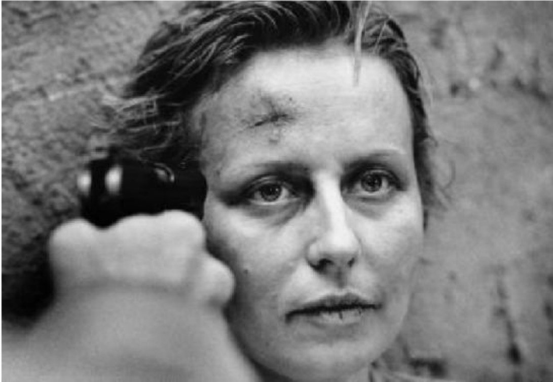
Krystyna Janda in „DAS VERHÖR“